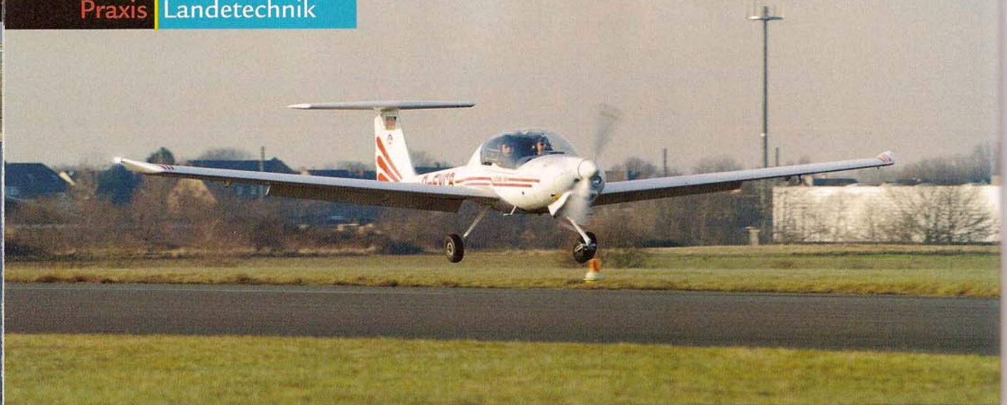
FLIEGT DER TIEFDECKER zu schnell an, bekommt er es mit dem Bodeneffekt zu tun – die Ausschwebestrecke wird länger.

Zwischen dem Visierpunkt, das heißt dem Punkt, auf den sich das Flugzeug mit konstanter Flug- und Sinkgeschwindigkeit zubewegt hat, und dem Aufsetzpunkt liegt die Schwebestrecke. Beabsichtigt man eine präzise Ziellandung, dann muss der Visierpunkt eine bestimmte Strecke vor dem Aufsetzpunkt liegen. Die Länge dieser Strecke hängt in erster Linie von der Anfluggeschwindigkeit, von der Klappenstellung, vom Wind und vom Baumuster ab. Durch den Bodeneffekt (Auftriebssteigerung bei geringer werdendem Widerstand) erhöht sich die Gleitzahl. Wird mit zu hoher Fahrt angefliegen, verlängert sich die Ausschwebestrecke beträchtlich gegenüber dem im Flughandbuch angegebenen Wert. Bei Tiefdeckern ist dieser Effekt ausgeprägter als bei Hochdeckern. Ist die Anfluggeschwindigkeit zu hoch, kann das Flugzeug lange im Bodeneffekt schweben und dabei viel Pistenlänge verbrauchen. Versuchen Sie auf keinen Fall, das Flugzeug an den Boden zu drücken, gegebenenfalls DURCHSTARTEN!