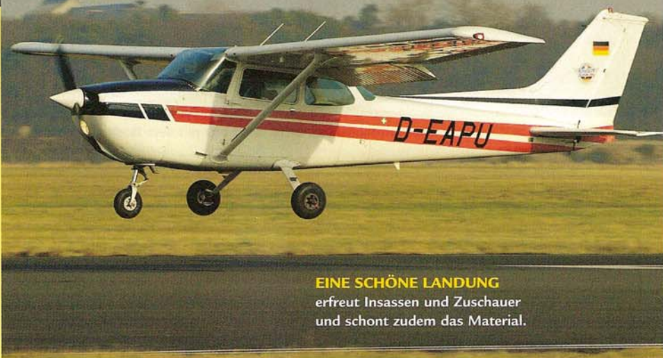
EINE SCHÖNE LANDUNG erfreut Insassen und Zuschauer und schont zudem das Material.